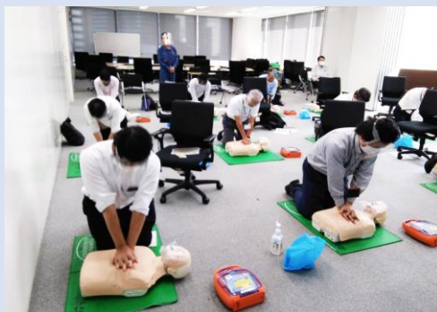
令和4年度 普通救命講習の様子